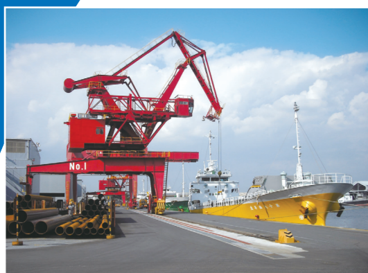
2) ▲ 水平引込式クレーン(10t)