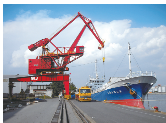
4) ▲ 水平引込式クレーン(20t)