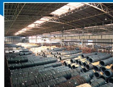
▲ 線材ヤード (No.3)