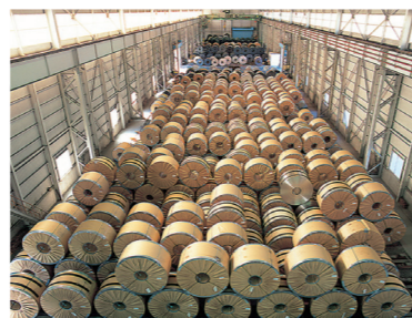
▲ 防湿ヤード (No.10)

荷役設備の完備した防湿倉庫及びコイル、パイプ、線材の専用倉庫を備え、安全で効率的な荷捌きを行います。