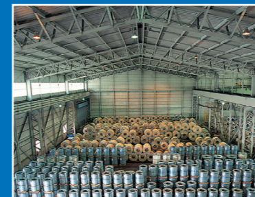
▲ コイルヤード (No.9)