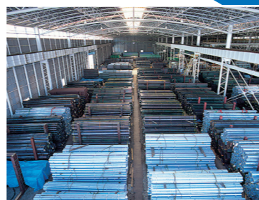
▲ パイプヤード (No.1)