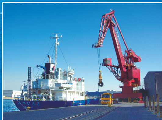
1) ▲ 水平引込式クレーン(32.2t)